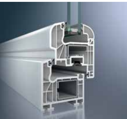
Schüco Corona CT 70 AS Rondo