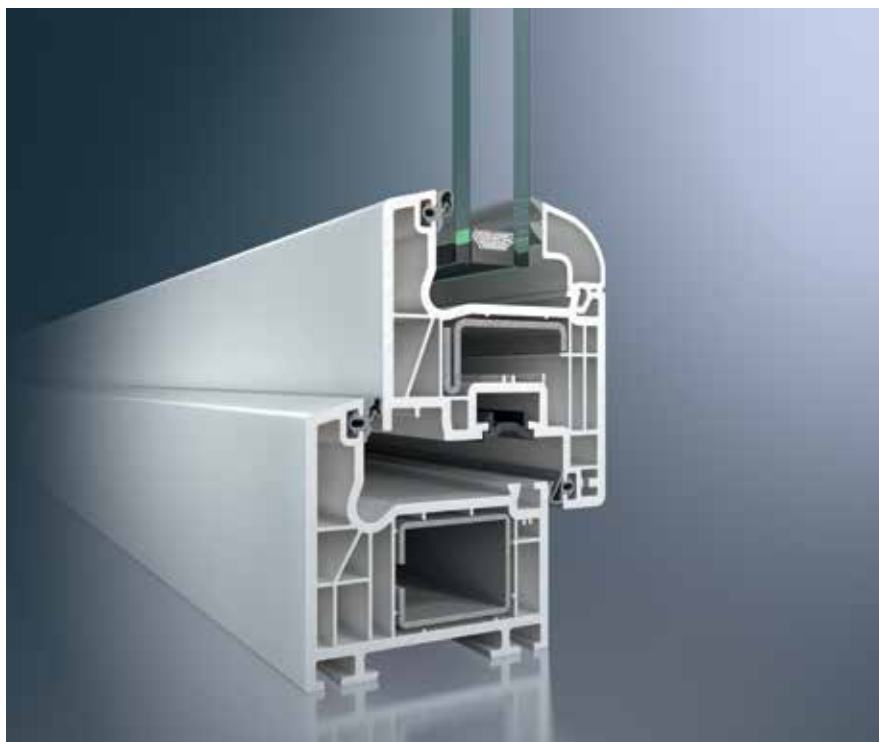
Schüco Corona CT 70 AS Classic

Il sistema in PVC Schüco Corona CT 70 con guarnizione di battuta si basa su una tecnologia a 5 camere. Il sistema si contraddistingue per le ottime proprietà termoisolanti e, al contempo, per le sezioni in vista snelle.