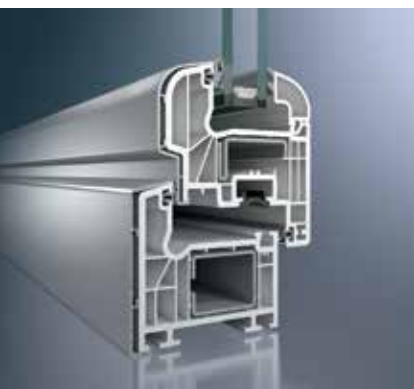
Schüco Corona CT 70 AS Rondo TopAlu